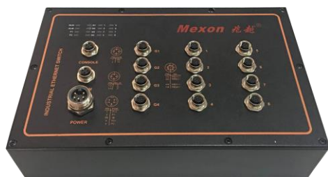
8 个 10/100/1000M POE 自适应电口, 4 个 1000MSFP 扩展槽或 4 个 10/100/1000M 自适应电口 (M12)