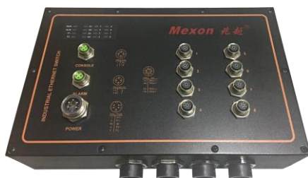
8 个 10/100M POE 自适应电口 (M12)