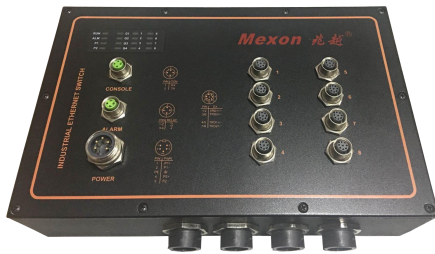
8 个 10/100M 以太网口，4 个 10/100/1000M 光口