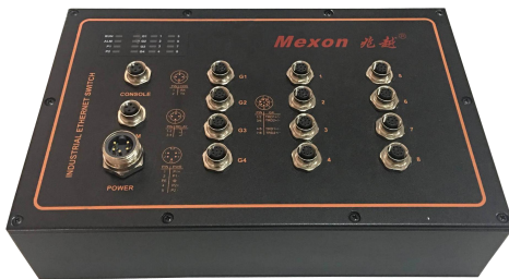
8 个 10/100M 以太网口，4 个 10/100/1000M M12 电口